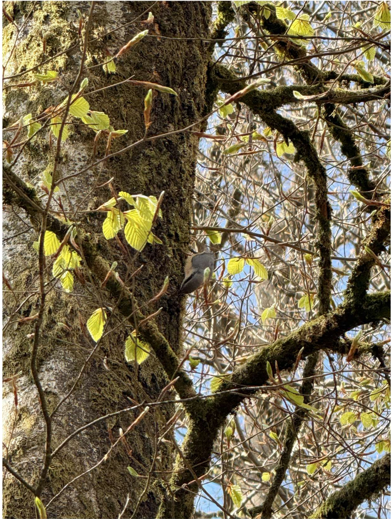
Chiny (49°44'22.6"N 5°21'42.6"E), le 18 avril