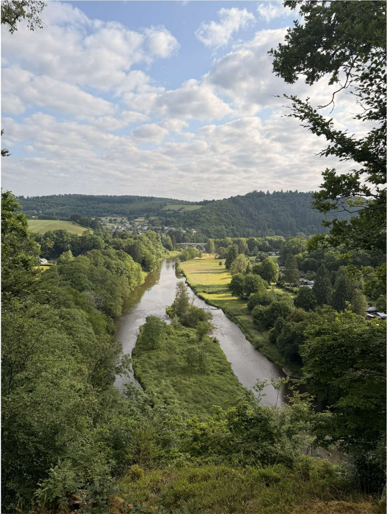
Dohan (49°47'19.2"N 5°08'19.5"E), le 3 juin