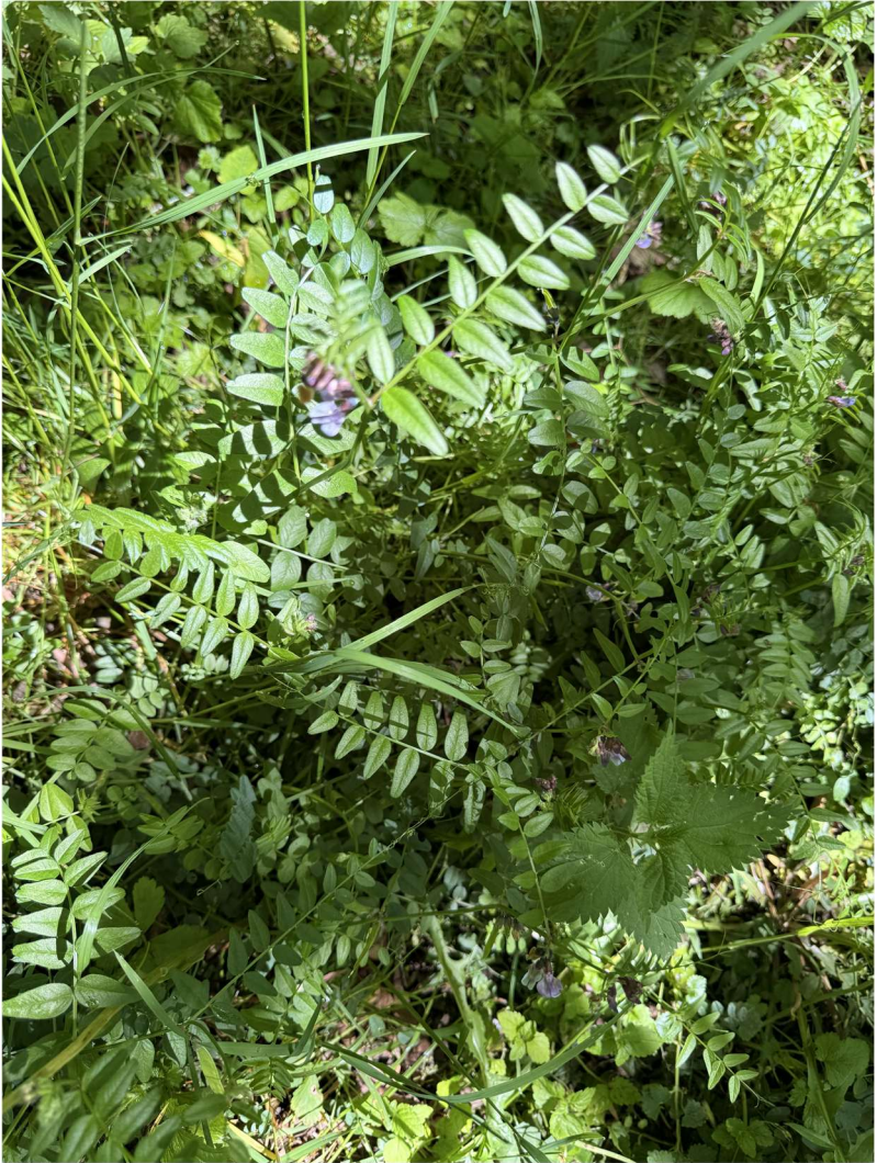
Membre (49°53'07.5"N 4°53'29.7"E), le 13 mai