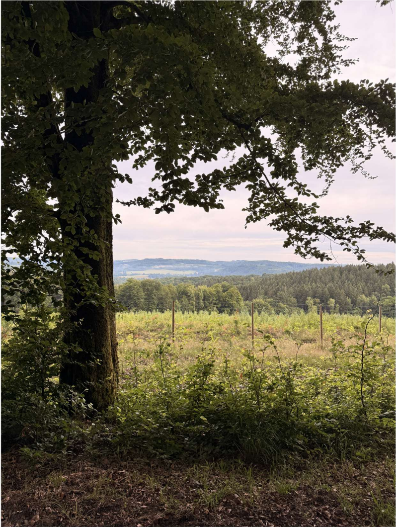
Dohan (49°46'38.8"N 5°09'58.9"E), le 5 juillet