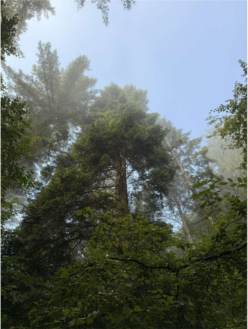
Poupehan (49°48'16.8"N 5°00'27.4"E), le 3 août