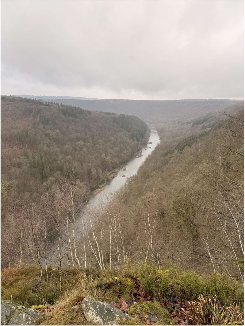
Florenville (49°45'01.3"N 5°15'56.9"E), le 28 février