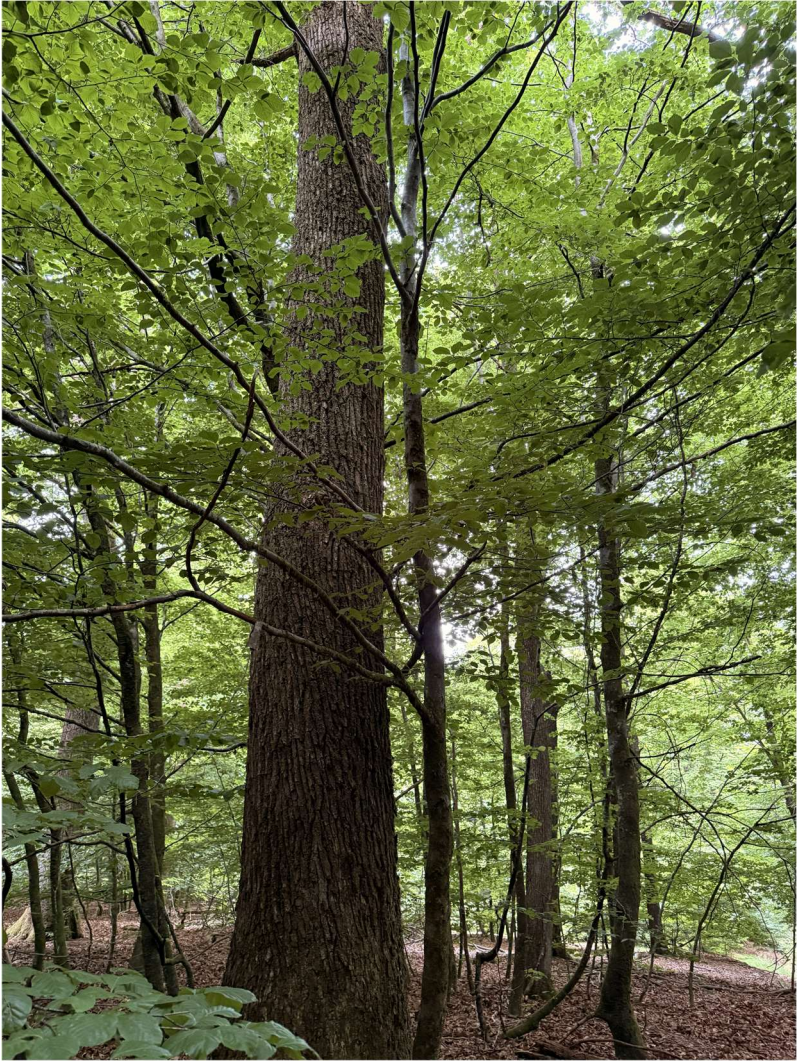
Dohan (49°46'46.2"N 5°10'20.0"E), le 5 juillet