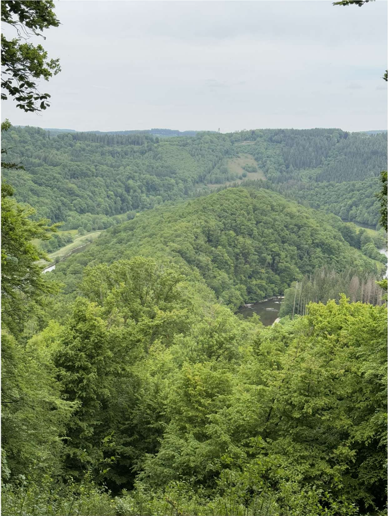
Corbion (49°48'12.9"N 5°02'27.6"E), le 21 mai