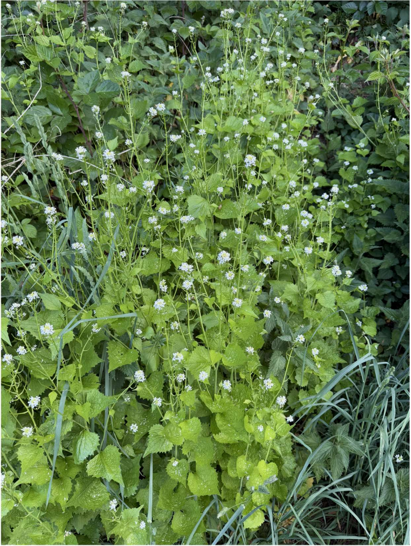
Bouillon (49°48'10.2"N 5°02'58.2"E), le 25 mai